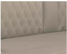
+ Echtleder-Wohnwelt Rubino ○