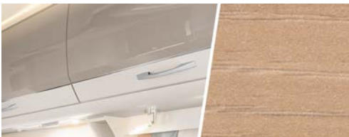
+ Holzdekor Noce Nagano