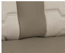
+ Wohnwelt Nubia ○