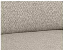
+ Wohnwelt Kari