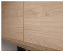
+ Möbeldekor Noce Nagano