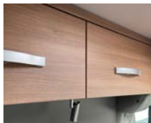
+ Möbeldekor Cape Town