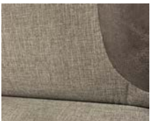
+ Wohnwelt Hygge