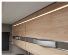
+ Möbeldekor Noce Nagano