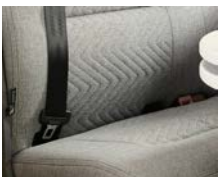
+ Wohnwelt Scandi