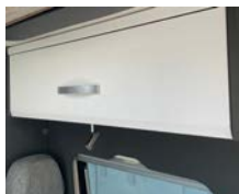
+ Möbeldekor Amberes Oak