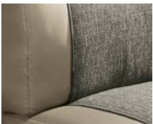
+ Wohnwelt Camino