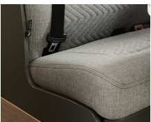
+ Wohnwelt Scandi